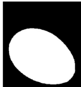
Gambar 3. Segmentasi citra telur