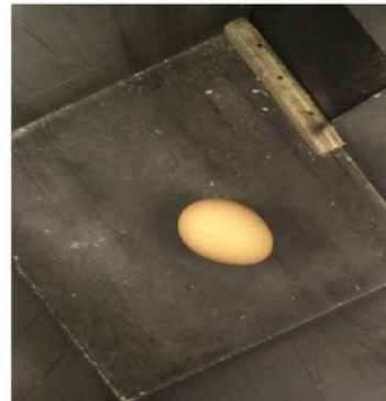
Gambar 2. Citra telur asli