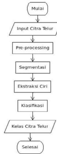
Gambar 1. Gambaran umum sistem

Pada penelitian ini proses klasifikasi dibagi menjadi dua proses yaitu proses training dan proses testing . Proses training bertujuan untuk melatih sistem. Jika proses training belum dilakukan maka sistem belum bisa bekerja. Sedangkan proses testing bertujuan untuk mengetahui tingkat keberhasilan atau akurasi sistem terhadap data masukan yang diberikan oleh pengguna. Gambar 4 adalah gambaran umum proses klasifikasi.